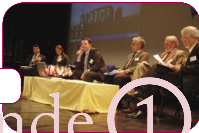
Table ronde 1