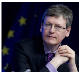
Laszlo Andor, Commissaire Européen

La Commission européenne s'est déclarée disposée, ce 21 août dernier, à accorder une enveloppe de 11,9 millions d'euros pour aider les travailleurs licenciés par l'automobiliste français en 2010 suite à une chute brutale de la demande de nouvelles voitures dans les pays européens. Les aides financières sont allouées dans le cadre du Fonds Européen d'Ajustement à la Mondialisation qui a pour mission de contrebalancer les effets négatifs de la mondialisation en donnant son soutien financier à des projets spécifiques. Ces moyens sont plus particulièrement dédiés à la formation et à l'entraînement des travailleurs afin de faciliter leur réintégration sur le marché du travail.